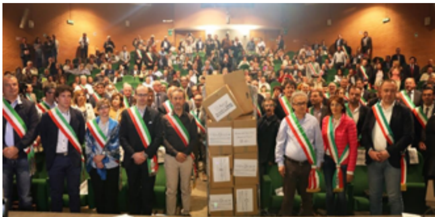
La protesta dei sindaci ASMEL. Al centro i faldoni delle migliaia di norme da rispettare